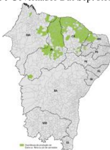
Figura 1 – Mapa de ocorrência de carnaúba (fibra, ou pó, ou cera) na área de atuação do BNB, no ano de 2004

No Rio Grande do Norte, de acordo com os dados do IBGE, os municípios de Apodi, Upanema e Felipe Guerra são os principais produtores de cera de carnaúba; apenas os municípios de Ipanguaçu e Açu têm registro de pequena produção de fibra (Figura 1). Para o ano de 2004, não se registra produção de pó nesse Estado, dado contestável pela realidade observada durante a pesquisa de campo, em que se observou a ocorrência de carnaubais e extração de pó nos municípios de Mossoró, Açu, Ipanguaçu, Carnaubais, Upanema, Apodi, Felipe guerra e Governador Dix Sept Rosado.