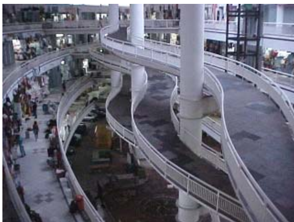
Figura ATR 26. Mercado Central