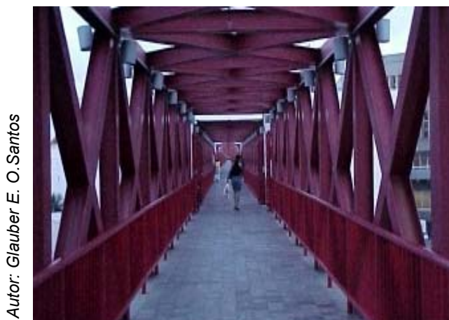
Autor: Glauber E. O. Santos