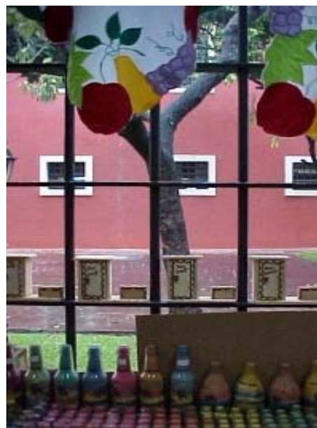
Figura ATR 27. Centro de Turismo