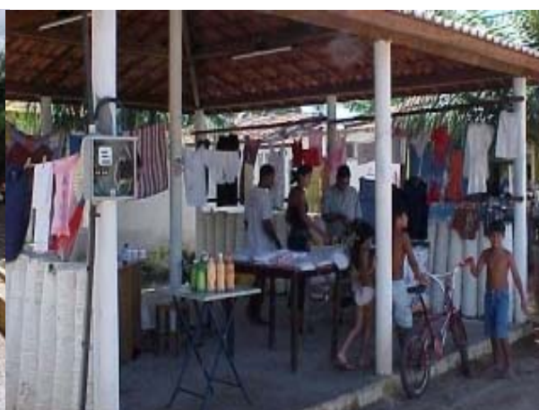
Figura ATR 29. Centro de Artesanato João-de-Barro