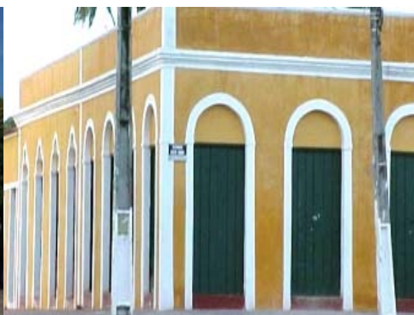
Figura ATR 24. Conjunto arquitetônico do centro de Aquiraz