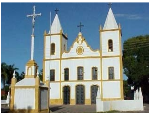
Figura ATR 23. Igreja de São José do Ribamar