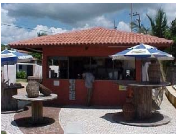
Figura ATR 28. Centro de Artesanato do Mirante da Lagoinha