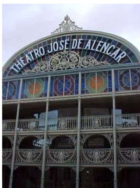
Figura ATR 25. Teatro José de Alencar