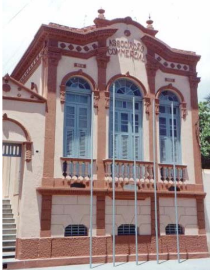
Figura PAT 79. Associação Comercial