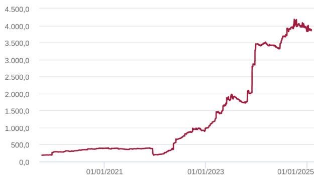
Patrimônio Líquido (R$ Milhões) - 07/10/2019 a 31/01/2025 (diária)