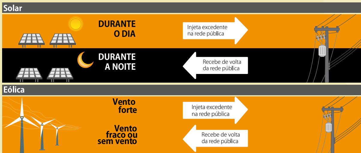
Figura 1 - Exemplos do funcionamento da micro e minigeração de energia solar e eólica

A microgeração distribuída de energia elétrica compreende as centrais geradoras que utilizam fontes renováveis ou cogeração qualificada, conectadas na rede de distribuição por meio de instalações de unidades consumidoras, com potência instalada menor ou igual a 75 kW.