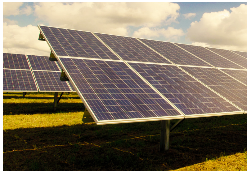
Tabela FNE Sol – Características

Na perspectiva de redução de custo de produção, o agronegócio brasileiro poderá utilizar a energia solar como alternativa de energia limpa e custo menor do que a energia convencional. Para tanto, existe o programa de crédito FNE-Sol, linha especialmente criada pelo Banco do Nordeste para o financiamento de sistemas de micro e minigeração distribuída de energia por fontes renováveis, para consumo próprio dosempreendimentos.