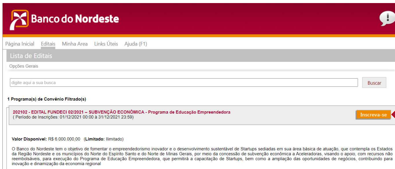
Figura 6 - Tela de Inscrição no Edital