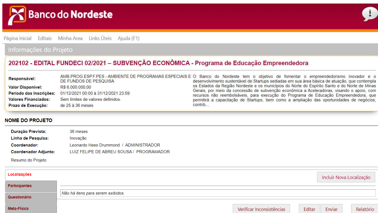
Figura 9 - Tela Informações do Projeto

11.10. Clicar em Editar caso deseje alterar as informações de Cadastro do Projeto. (Figura 9)