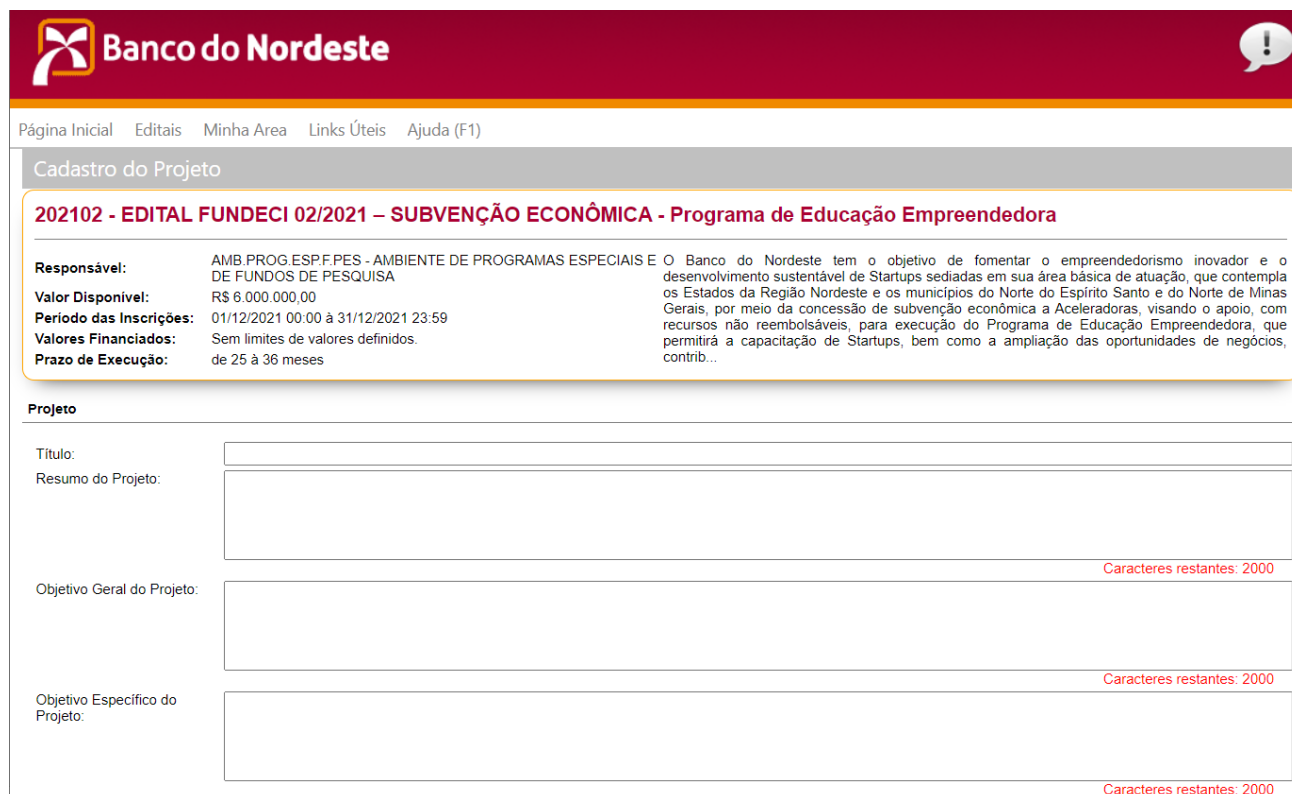
Figura 8 - Tela Cadastro de Projeto

11.1. Título : Identificar o Programa de forma concisa e objetiva, preferencialmente até 60 caracteres, incluindo espaços.