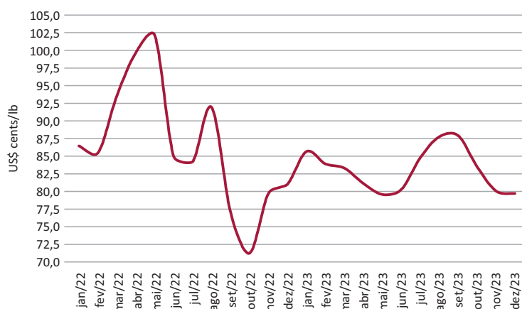
Gráfico 1 – Evolução dos preços internacionais do algodão, na Bolsa de Nova Iorque

De setembro a dezembro, houve queda de 9,4% na cotação futura para março/24 (para US$ 0,7969/libra-peso), na mesma Bolsa, influenciada por expectativas de oferta acima da demanda global na atual safra, segundo o Comitê Consultivo Internacional do Algodão (ICAC). Este aponta previsão de produção superior à do USDA (24,914 milhões de toneladas) e consumo mundial de 23,945 milhões de toneladas, inferior à do USDA (CEPEA, 2023). Afetam negativamente os preços o fraco desempenho das exportações norte-americanas e a valorização do dólar frente a outras moedas (CONAB, 2023a).